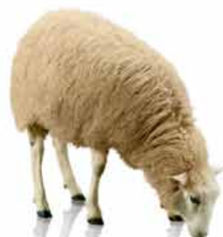
Ovis aries. ("avis") Vejoms iki 10000 m 2

Stebėdami laukuose besiganančias avis supratome, kaip galima suformuoti idealią veją: reikia pjauti po nedaug, tačiau tai daryti nuolat ir atsitiktinai pasirenkamose vietose. Tai mus įkvėpė sukurti Husqvarna Automower® robotą vejapjovę - neabejotiną šios srities lyderį. Sužinokite kaip jūs galite turėti idealią veją, be jokių pastangų.