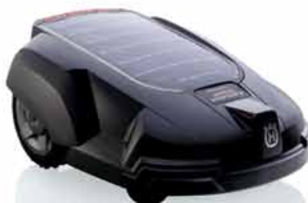
Automower® Solar Hybrid. Vejoms iki 2200 m 2