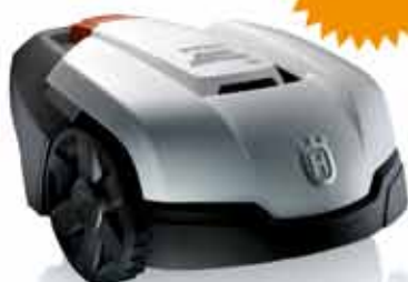
Automower® 305. Vejoms iki 500 m 2