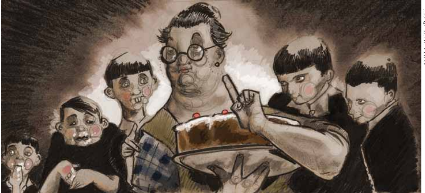
ARIEVLIN ILLUSTR. (FLICKR)

savo kokybę, o mažesnės ūkininkų pajamos lemia lėtesnę ekonomikos raidą ir mažesnę visuomenės gerovę. Kitas pavyzdys yra Vilniaus centre esančių negyvenamų ar apleistų plotų gausa. Negalėdami nusipirkti gyvenamojo būsto miesto centre, gyventojai priversti keltis į užmiestį. Toks gyventojų elgesys lemia neefektyvų esamos miesto infrastruktūros panaudojimą, dideles infrastruktūros kūrimo išlaidas naujuose rajonuose bei išaugusias kuro, laiko ir kitas sąnaudas. Šioje vietoje vėlgi norėtusi paminėti įkalinimo įstaigas, kurios vis dar stovi kone geriausiose Vilniaus vietose.