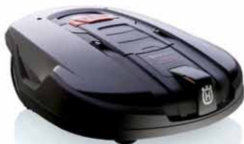
Automower® 260ACX. Vejoms iki 5500 m 2