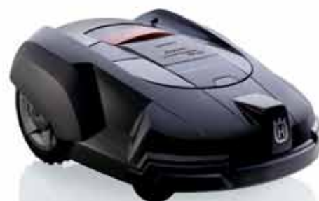
Automower® 230ACX. Vejoms iki 3000 m 2