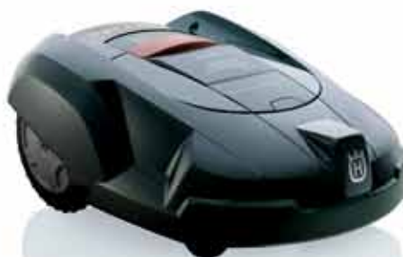
Automower® 220AC. Vejoms iki 1800 m 2